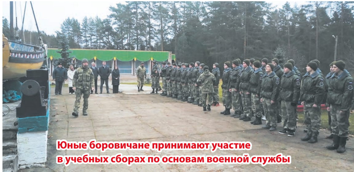
Юные боровичане принимают участие в учебных сборах по основам военной службы

ваны на два взвода по 17 человек. Строгий режим, дисциплина и никаких гаджетов.