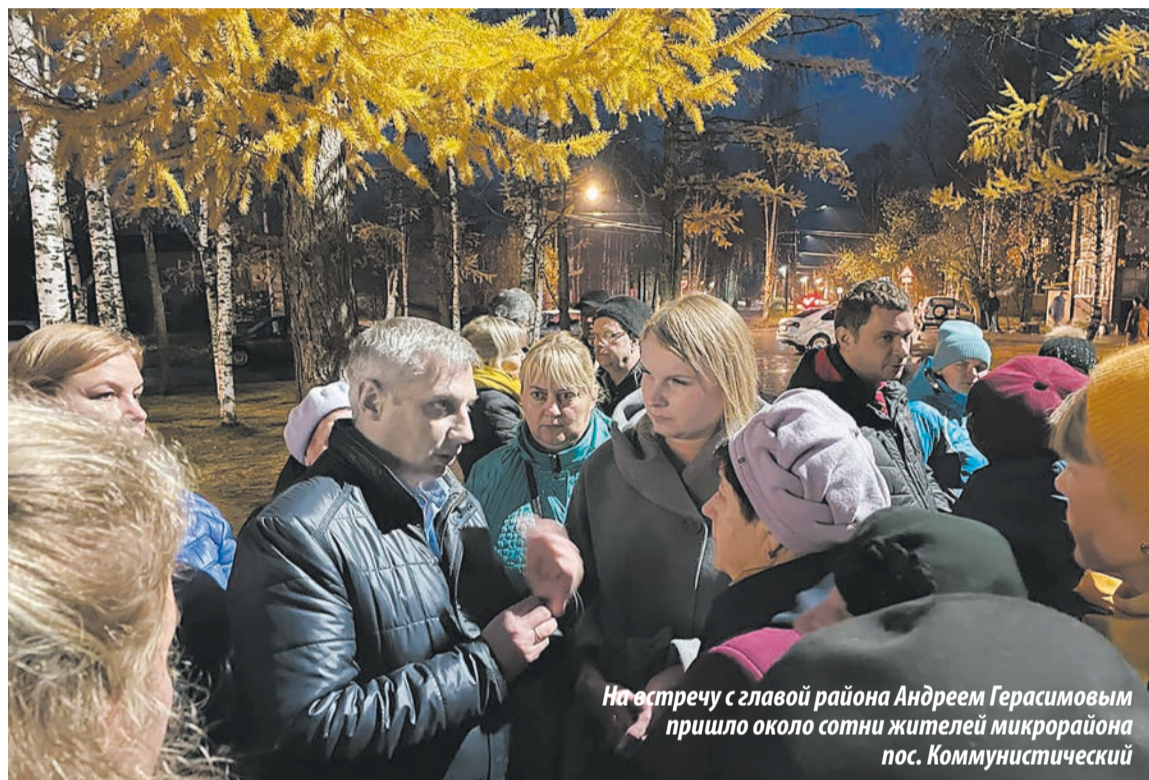
На встречу с главой района Андреем Герасимовым пришло около сотни жителей микрорайона пос. Коммунистический

Жители микрорайона пос. Коммунистический обсудили с главой района Андреем Герасимовым более 50 наиболее острых вопросов