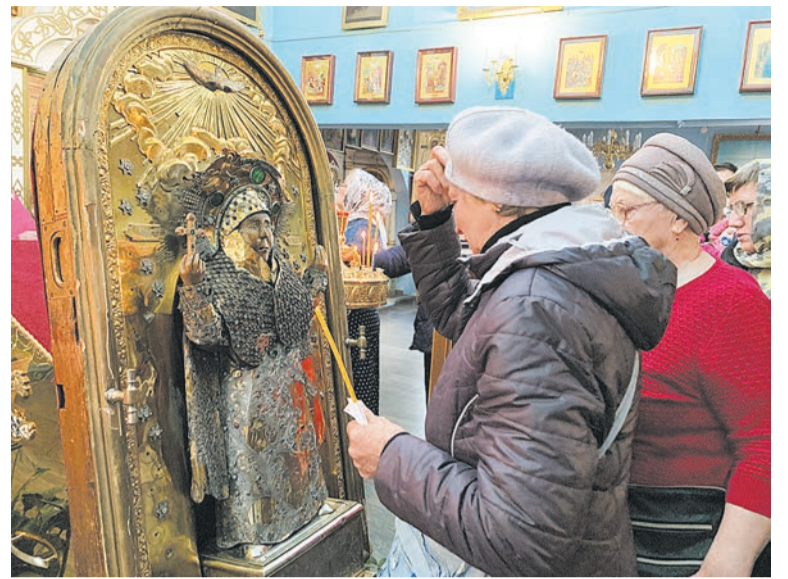
На молебн перед чудотворным образом пришло множество боровичан

верующие боровичане всегда надеялись на то, что храм будет восстановлен. Пятницкий храм, действительно, возвратили верующим в 1960 году в связи с закрытием Успенской церкви.